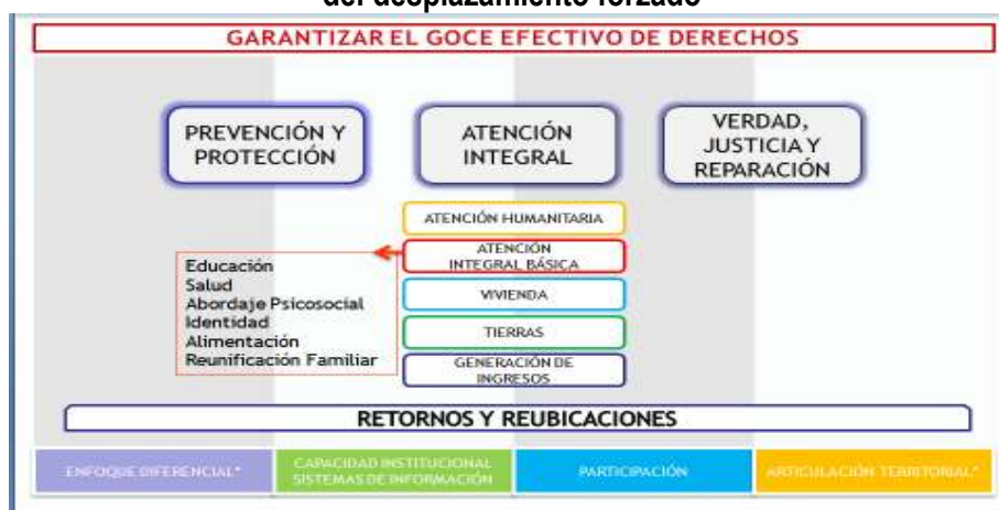
Gráfico N°3 Componentes de la política de prevención, protección y atención del desplazamiento forzado

Esas actividades se enmarcan en proyectos formulados con base en los componentes definidos en la política pública de prevención, protección y atención del desplazamiento forzado, el primero de ellos es prevención y protección, el segundo atención integral y el tercero, verdad, justicia y reparación de las víctimas. El componente de atención integral está compuesto por 5 subcomponentes, a saber: atención humanitaria, atención integral básica, vivienda, tierras y generación de ingresos. Así mismo, la política contempla unos componentes transversales que son el enfoque diferencial, la capacidad institucional, la participación y la articulación territorial. Todo lo anterior se lleva a cabo bajo un escenario de retornos o reubicaciones de la población desplazada.