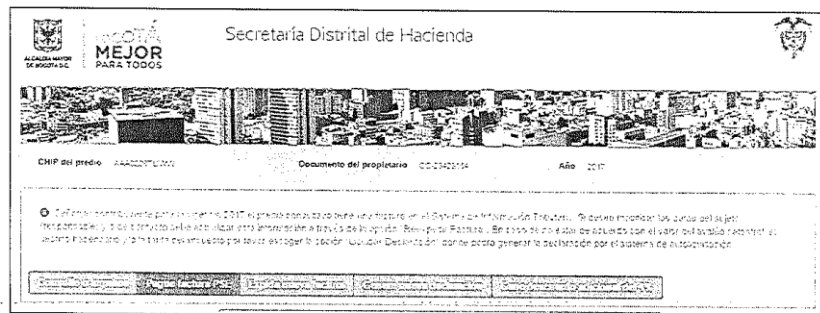
Página Web SDH – Pago PSE, Reexpedición de Factura y Declaración

Pagos seguros en línea por la opción PSE: los contribuyentes pueden realizar el pago de sus impuestos en línea, bien sea factura, declaración o el pago por cuotas.