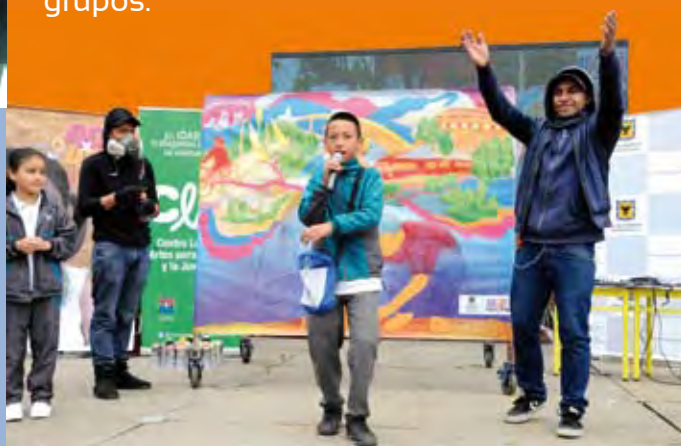
Participantes en las actividades realizadas por el grupo de cultura tributaria

Este año el grupo de cultura tributaria ha llegado a más de 18 mil bogotanos y bogotanas. La meta para 2015 es desarrollar 251 actividades.