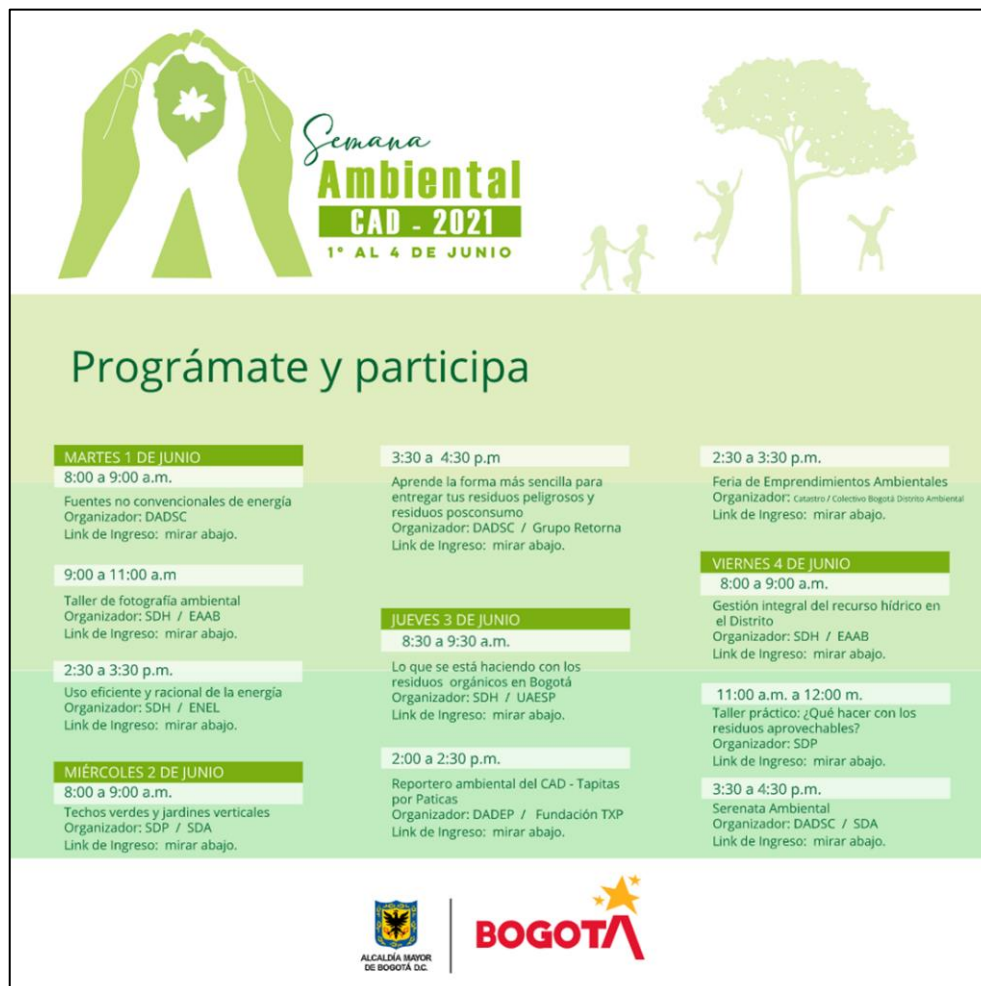
FIGURA No. 1 SEMANA AMBIENTAL CAD -2021