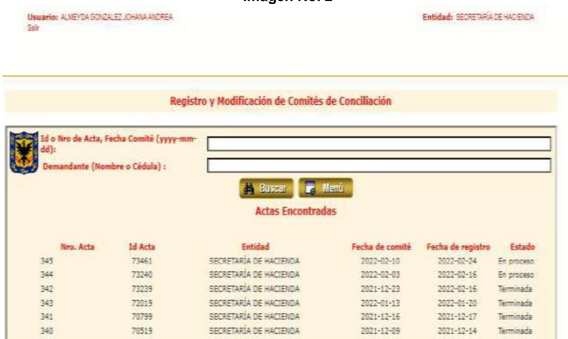
Imagen No. 2