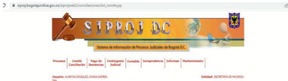
Imagen No. 1