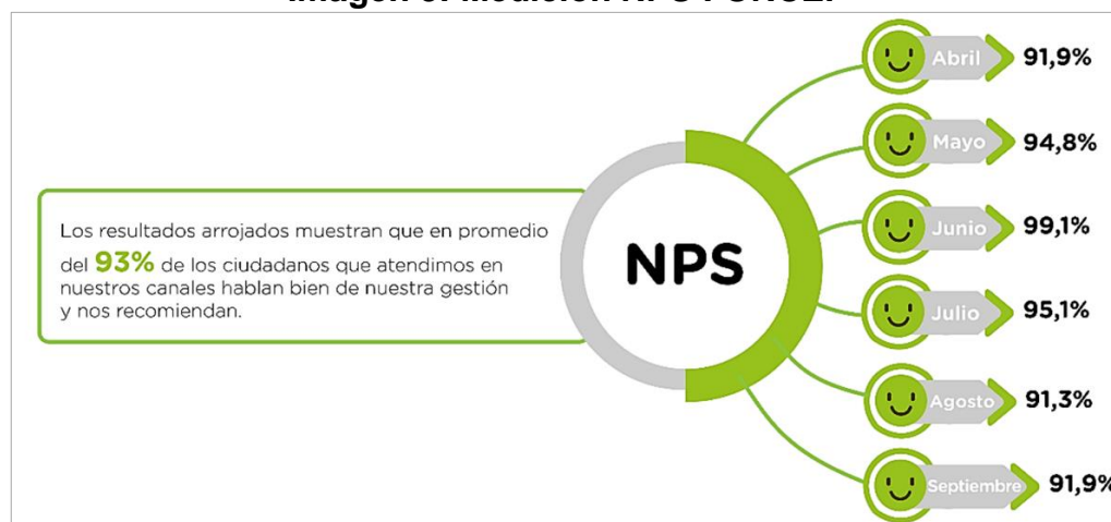
Imagen 3: Medición NPS FONCEP

A partir de abril iniciamos el proceso de medición de satisfacción de nuestros usuarios con la aplicación de la herramienta NPS (NET PROMOTER SCORE) que permite medir la lealtad de los clientes de una empresa con base en la recomendación de sus servicios y/o experiencias, obteniendo: