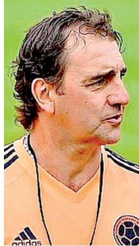
NÉSTOR LORENZO tendrá a su cargo la dirección de la Selección Colombia por los próximos cuatro años.