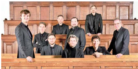
ESTE ENSAMBLE , líder en la interpretación de piezas polifónicas de los siglos XV y XVI, con especial énfasis en el repertorio de los Países Bajos, se presentará este domingo en la Sala de Conciertos de la Biblioteca Luis Ángel Arango.

Con oboe, clarinete y fagot, Tres Palos Ensamble es una propuesta que desde hace una década