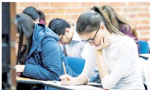
SEGÚN FEDESARROLLO garantizar el acceso a dos millones de niños de 3 a 5 años, se necesitaría entre $1,7 y $2,7 billones de pesos.

es un problema central del sistema educativo colombiano. En educación básica, se estima que por cada 100 niños que entran a primero de primaria, solo 44 logran graduarse de bachillerato a tiempo. Además, de 100 graduados de bachillerato a nivel nacional, solo 39 logran acceder a educación superior.