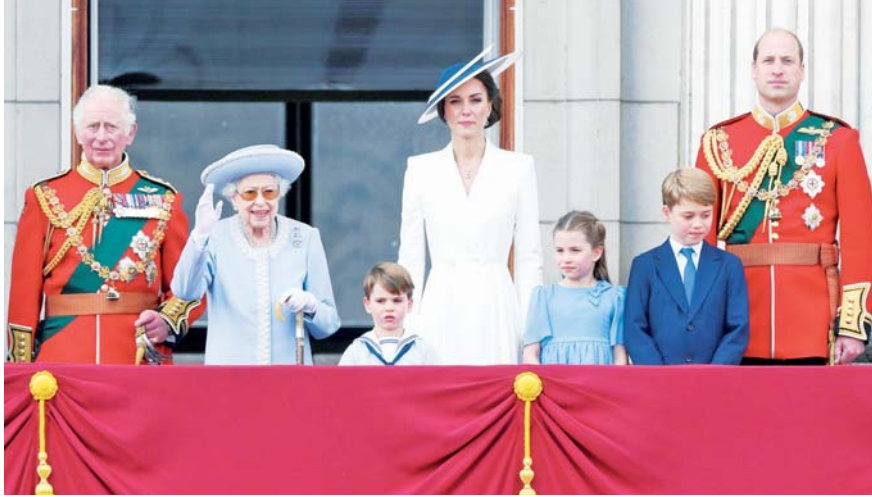
CON LA sonrisa que la ha caracterizado, la reina Isabel II apareció en el balcón real con gran parte de su familia: su hijo y heredero al trono, el príncipe Carlos, el príncipe Guillermo, su esposa Catalina y sus tres pequeños hijos.

Cientos de miles de personas se agolparon en los alrededores del palacio, acordonados con barreras metálicas y vigilados por policías con sus característicos cascos