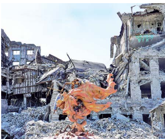
EN RUINAS quedó la mayor parte de Mariupol tras los bombardeos. Esa estratégica ciudad está hoy bajo control ruso.

Así lo han admitido dirigentes políticos, como el presidente estadounidense Joe Biden y el secretario de la Organización del Tratado del Atlántico Norte, Jens Stoltenberg quienes coincidieron en afirmar que "debemos prepararnos para el largo plazo...Lo que vemos es que esta guerra se ha convertido ahora en una guerra de desgaste".