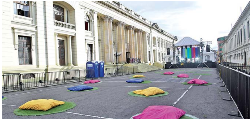
ESTE ESCENARIO e Idartes presentan una jornada especial de este encuentro de salsa este viernes, a partir de las 5:00 p.m. con entrada libre.

La primera agrupación que pisará la tarima del Bronx Distrito