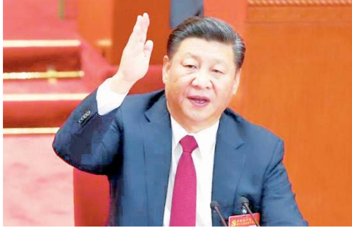
EL PRESIDENTE Xi Jinping quiere “reunificar” a Taiwán con “la madre patria” y no excluye el uso de la fuerza para lograrlo.

Taiwán aún no forma parte del El Marco Económico Indo-Pacífico (IPEF), pero un