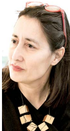
ISADORA ZUBILLAGA, vicecanciller del gobierno paralelo del opositor Juan Guaidó, encabezó el grupo de mujeres que en gira por Europa y Estados Unidos expuso la crisis política y social venezolana. /Foto archivo

mediados de mayo que iba a flexibilizar algunas de las sanciones vinculadas al embargo de crudo venezolano que rige desde 2019.